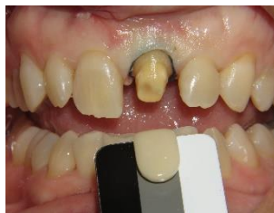
Préparation de la nuance (souce)