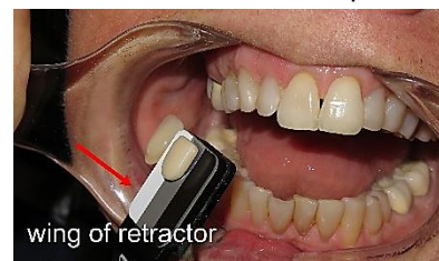
Enrouleur à ailettes